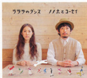
ノノホとコーセイ 1stアルバム「ラララのダンス」 2,200円 ご注文・お問い合わせ ロバハウス http://www.roba-house.com/

「父やいまの自分とはぜんぜん違う音楽を聴いて、ぜんぜん違う服装をしていました。父は何も言いませんでしたが、夜、眠っているわたしの耳元で『目を覚ませジグ』と言っていたそうです。『ジグ』はこころのなかにも住んでいる妖精。父の造語です。ジグが目覚めると、うたいたくなったり何かつくりたくなったり、想像力がムクムクとわいてくる」。子どもの頃は想像力の固まりだった、と野々歩さん。眠っていた「ジグ」が再び目覚め、うたい出した野々歩さん。その素直な歌声に、わたしたちの想像力も広がります。