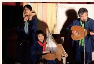
心温まる古楽器の演奏