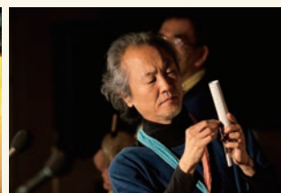
身近な素材で楽器を作る