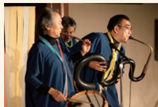
愉快的音のパフォーマンス