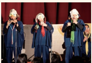
新たな音の世界の発見