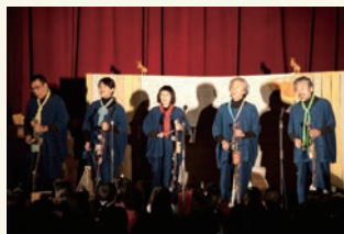
空想楽器により音の遊びを知る