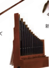
ポルタティーフォルガン