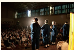
音楽の原点に触れる