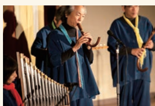
柔らかくて、なつかしい音楽