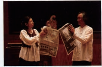
新聞紙をかサカサー、クシュクシュッ、ビリビリー。そこにリズムが生まれ、音楽になっていくと、子どもたちは大喜び!