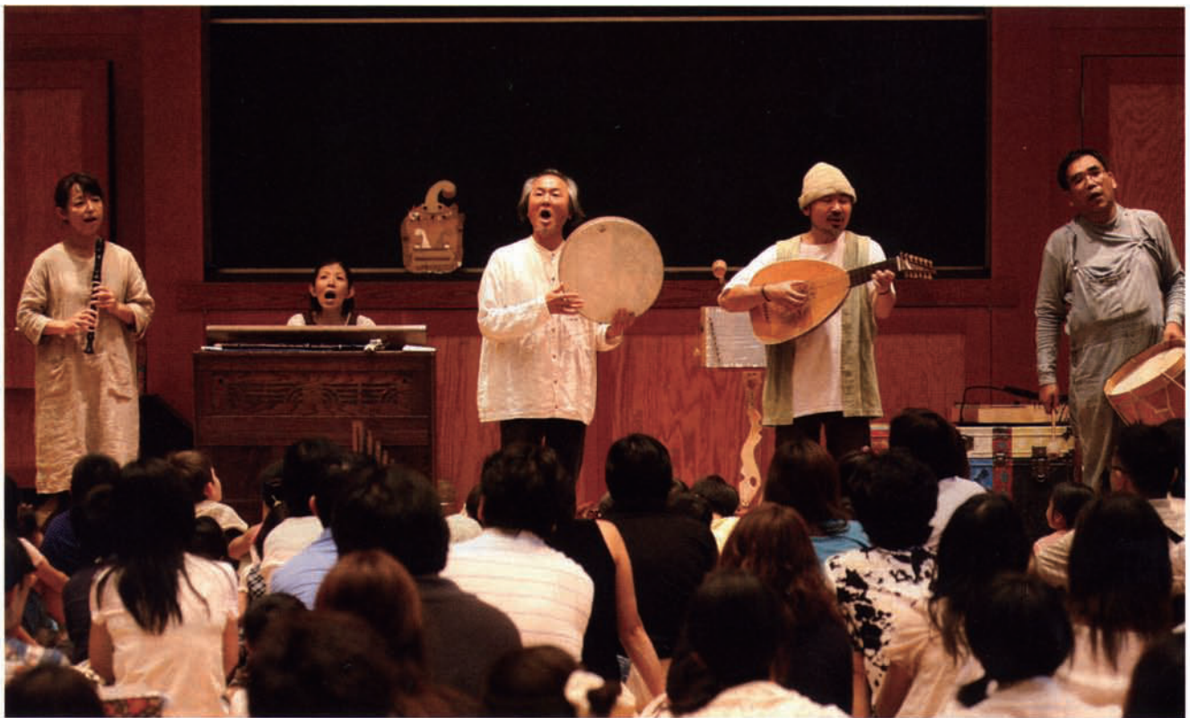
〔幼児音楽研究会20周年記念例会〕でのライブより〕