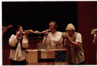
牛乳パックもガラスのビンも、「ロバの音楽座」の手にかかると、ものすごくたのしそうな楽器に変身!